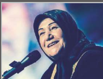
همایش آموزش خانواده