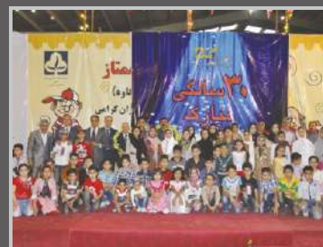
جشن دانش‌آموزان ممتاز