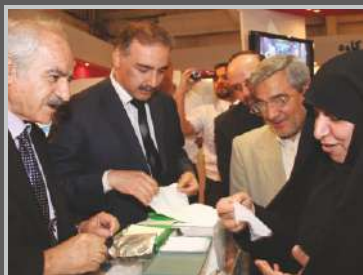
نمایشگاه ایران مد - ۱۳۸۹