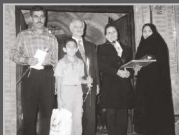
جشن دانش آموزان ممتاز کارخانه باند و گاز و پنبه کاوه ۱۳۸۵