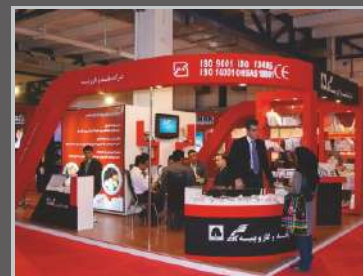
نمایشگاه ایران هلت - ۱۳۹۰