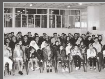
جشن دانش آموزان ممتاز کارخانه باند و گاز و پنبه کاوه ۱۳۸۱