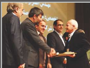
دریافت جوایز و افتخارات