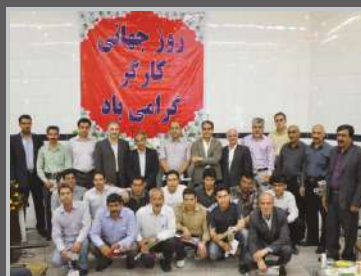
جشن روز کارگر