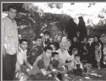
تورهای سیاحتی و تفریحی کارکنان کاوه سرچشمه آب گرم محلات ۱۳۸۴