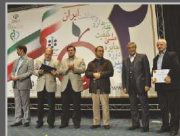
کسب اولین و تنها دارنده جایزه ملی کیفیت در تجهیزات پزشکی یکبار مصرف در سطح اهتمام - ۱۳۹۰