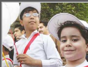
برنامه‌های داوطلبانه اجتماعی و خیریه