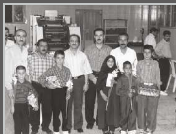
جشن دانش آموزان ممتاز کارخانه باند و گاز و پنبه کاوه ۱۳۸۰