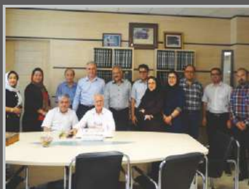
برگزاری جشن تولد پرسنل شرکت باند و گاز و پنبه کاوه