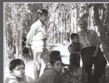
تورهای سیاحتی و تفریحی کارکنان کاوه غار علیصدر ۱۳۸۳