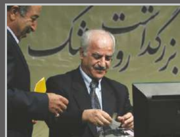
جشن روز پزشک