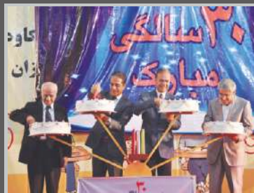
برگزاری جشن ۳۰ سالگی شرکت باند و گاز و پنبه کاوه ۱۳۹۱